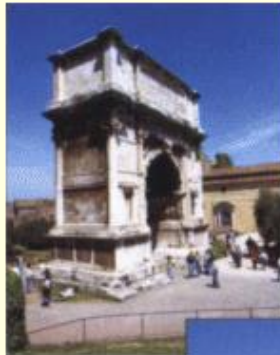
Titusbogen, Rom, 81 n. Chr.