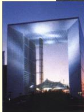
La Grande Arche, Paris, 1983–1989